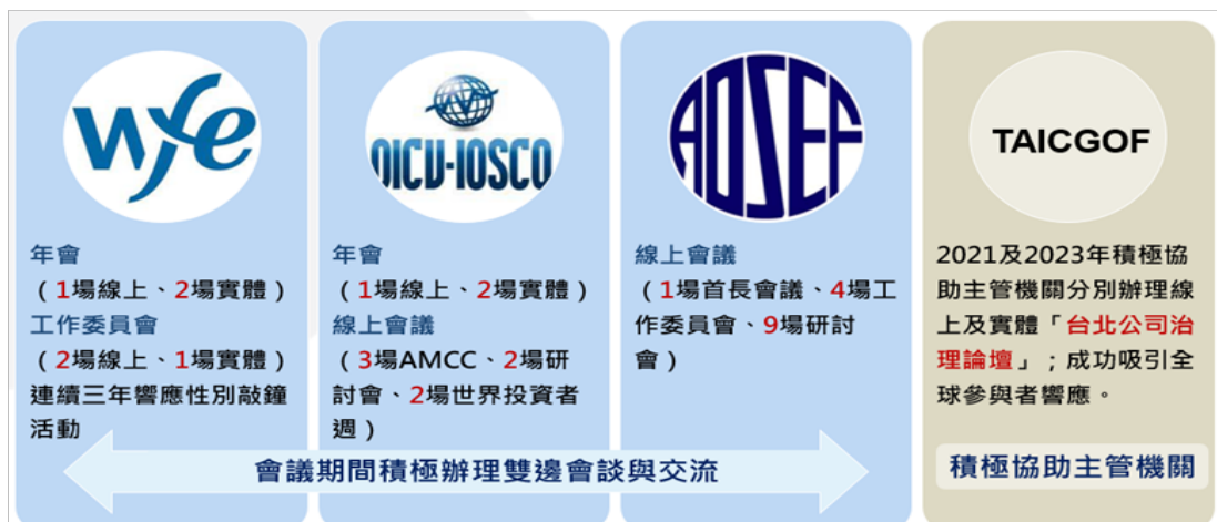
圖 4：證交所與國外證券期貨機構交流合作概況

為增加臺灣資本市場國際知名度並提升外資參與程度，證交所及各證券期貨周邊單位致力辦理國際交流及招商引資。證交所及櫃買中心近年來積極參與 WFE、AOSEF 及 IOSCO 舉辦之年會、工作委員會及研討會。2021 至 2023 年間，證交所成功辦理 24 場型式多元之引資活動，並協助主管機關籌辦第 13、14 屆臺北公司治理論壇；戮力推廣臺股優勢及前景，強化投資人信心，促進臺灣資本市場成長。詳細辦理情形請詳下圖 4：