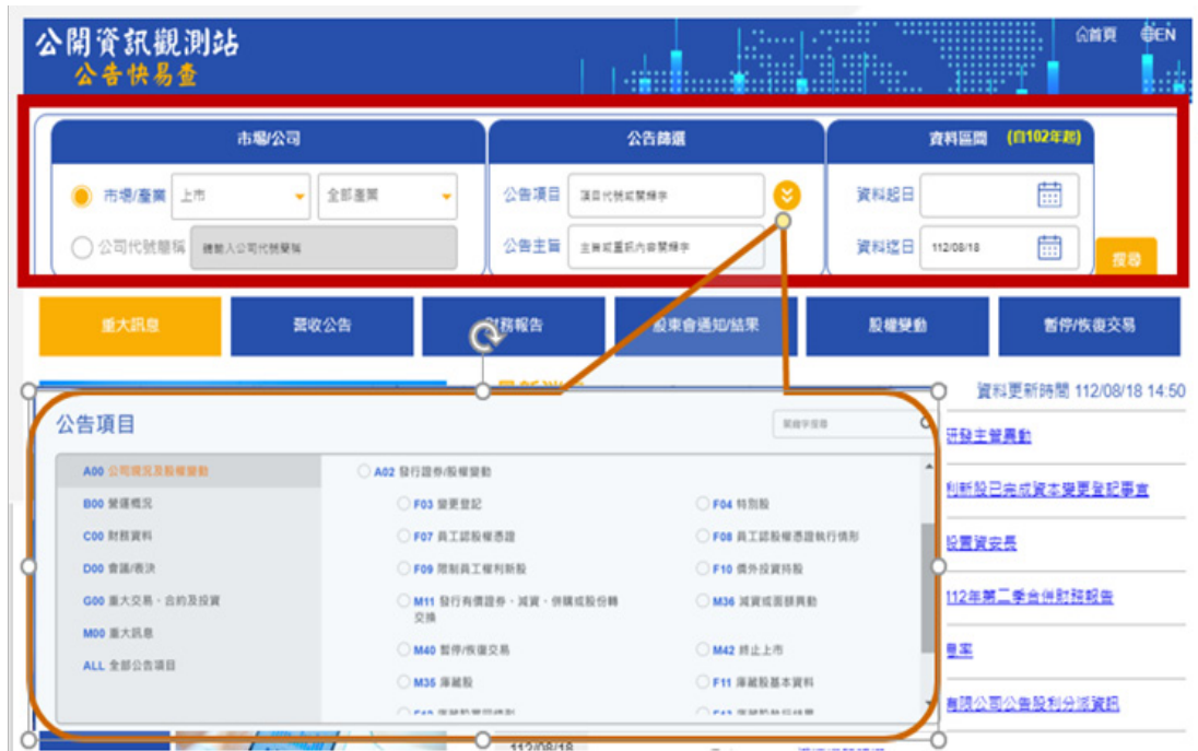
圖 2：公告快易查介面

而公告快易查網站建置後，證交所也持續擴充網站資訊項目，例如於2023年6月新增「ESG 資訊」。嗣後證交所亦會視公開資訊觀測站新增之資訊及使用者需求，配合新增至公告快易查，提供使用者更豐富的查詢網站。公告快易查介面概覽如下圖2。