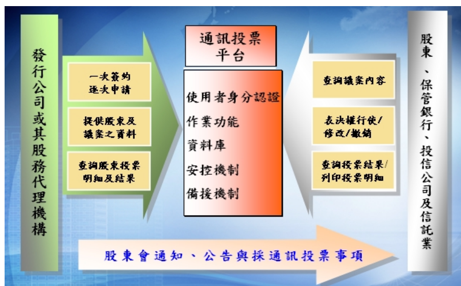
圖一 平台架構示意圖

以網際網路為作業介面，搭配網路安全機制之建置、以 CA 電子憑證及數位簽章作為平台使用者之身份識別工具，對投票之紀錄留存稽核軌跡等方式，建立便捷、安全與可稽核驗證之通訊投票平台，本平台架構示意圖如下：