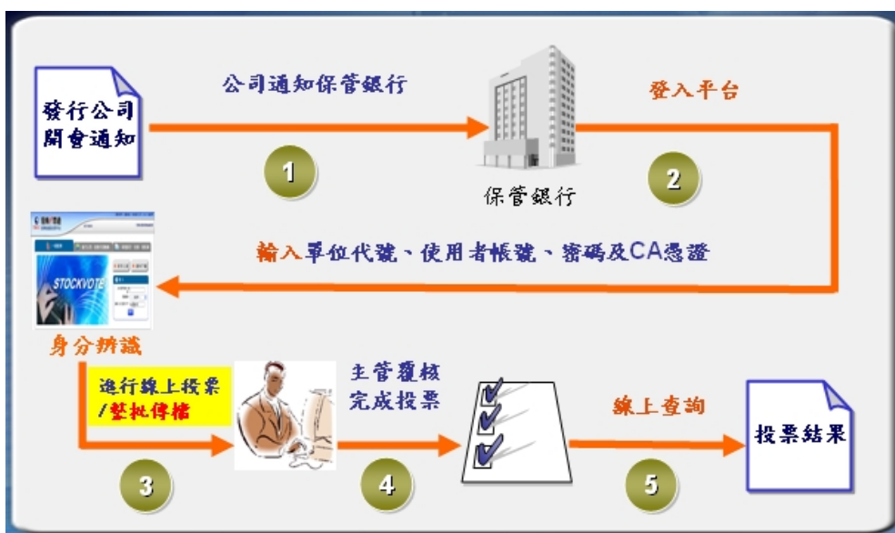
圖五 保管銀行、投信公司、信託業投票流程