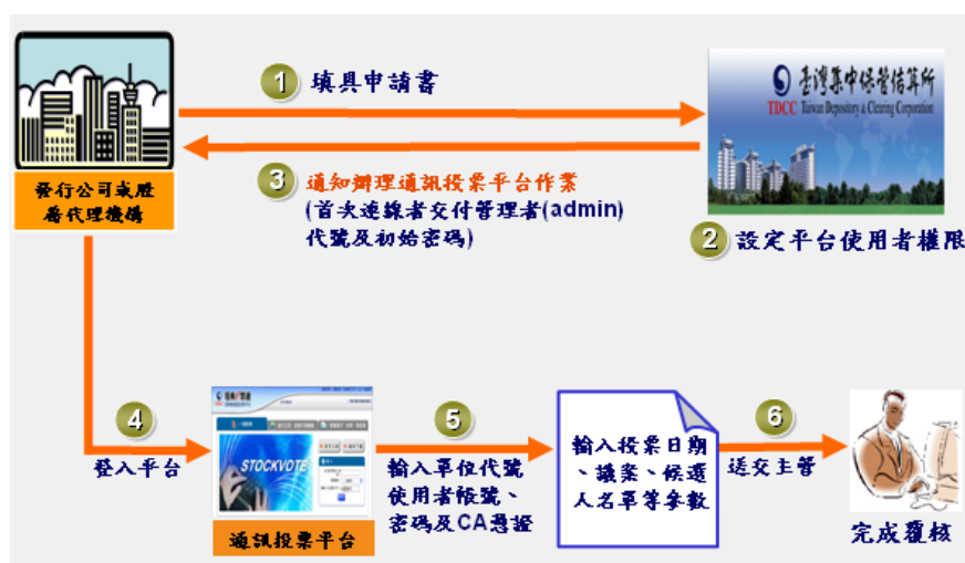
圖二 發行公司申請使用「股東 e 票通」作業流程

發行公司使用「股東 e 票通」時，須先與集保結算所簽訂約定書，並於每次召開股東會或股東臨時會欲使用「股東 e 票通」時，逐次填具通訊投票平台相關作業申請書，指定使用本平台之 CA 憑證編號、公司統一編號、申請單位代號、管理者基本資料、發行公司授權股務代理機構處理資料之範圍等資料，加蓋原留印鑑向集保結算所申請。