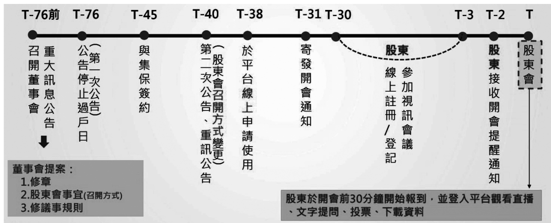
圖二 股東會視訊會議相關作業時程